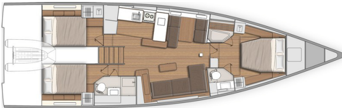
Versione 3 cabine 3 locali bagno - Cabina skipper: