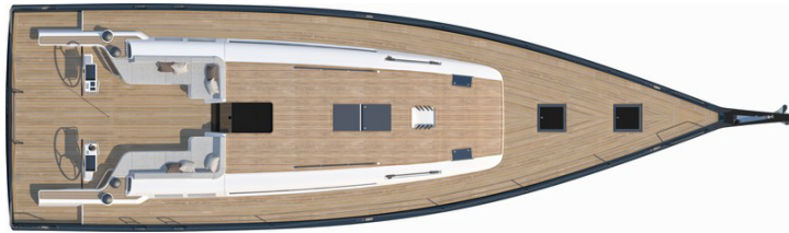
Versione 3 cabine 2 locali bagno: